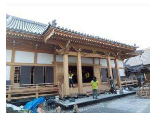
建設中の寺を見学